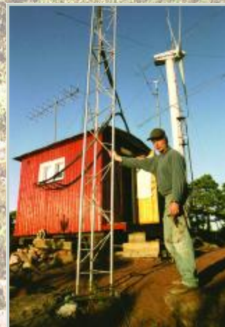
Stanoviště je umístěno poblíž jedné z mnoha větrných elektráren na Alandských ostrovech.