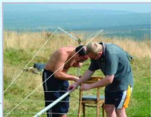
Stavba antény 18 el. M2 - OK1UKO, OK1VVT