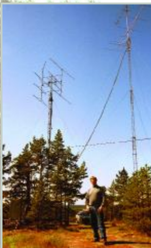
Sture, OH0JFP, stanoviště OH0A