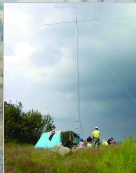
Stanoviště na 432/1296 MHz