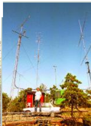
Contest stanoviště OH0JFP jižně od Mariehamnu.