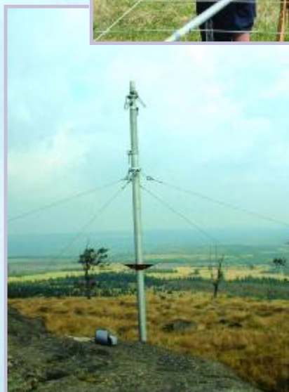
Výsuvný 16m stožár pro 18 el. M2