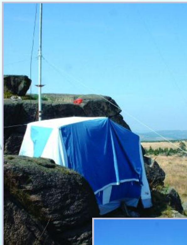
Stanoviště na 144 MHz - Loučná - JO60TP 956 m n. m.