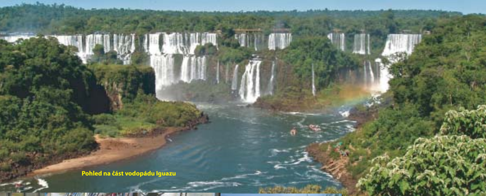
Pohled na část vodopádu Iguazu