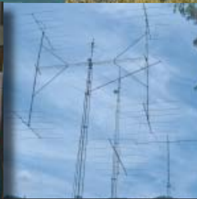
Stožáry s 4x5el na 10m, 6/6 na 20m a vzadu otočná 4el + fixní 2el na 40m