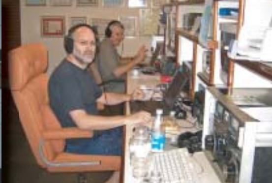
PY5/OK7MT a PY5/OK5MM při ARRL CW contestu