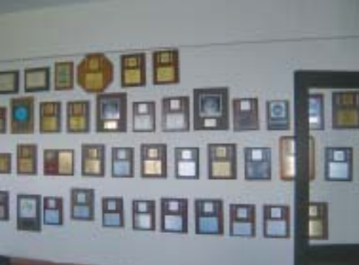
Část Atilanovy (PY5EG) síně slávy - plakety jsou téměř výhradně za 1. místa WW v nejrůznějších contestech.