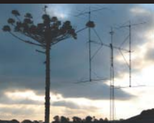
Anténa H 4x5el na 10m