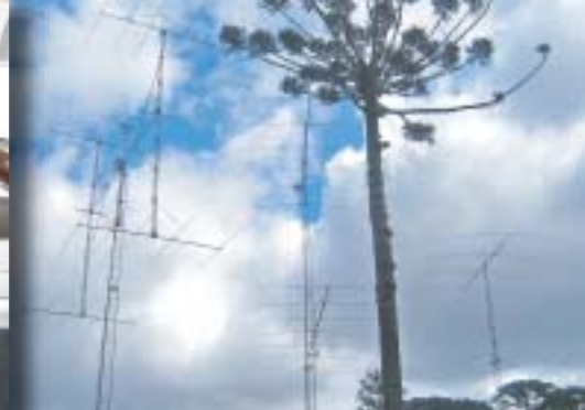
V popředí typický místní strom borovice Araucaria. Podle ní se také místní klub ZW5B jmenuje Araucaria DX Club