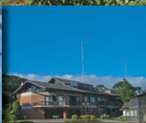
Rezidence (letní sídlo) pana domáčího PY5EG, v pozadí 4el na 80m