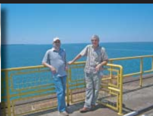
My dva (PY5/OK7MT a PY5/OK5MM) na přehradní hrázi elektrárny Itaipu