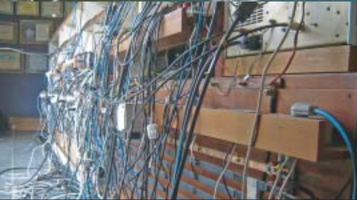
Zadní strana operátorského stolu v hamovně - sběrnice ve spodní části jsou jednotlivé fáze 230V a 110V rozvodu, nahoře jsou pak ještě podobně udělané sběrné stejnosměrného rozvodu 12V a 24V. Spousta kabelů k jednotlivým TRX, PA, počítačům, rotátorům, anténím přepínačům a datový Ethernet