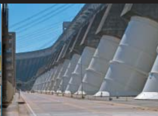
Hydroelektrárna Itaipu - bílé roury jsou přívodní potůbky (průměr roury 8m) k jednotlivým turbínám