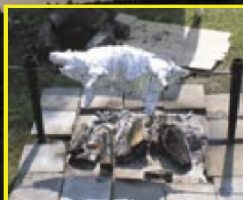
Beran na rožni - zasloužená odměna