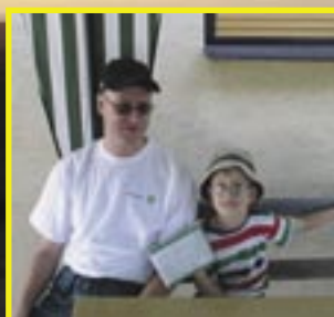
Nová generace liškařů OK2UPP a syn