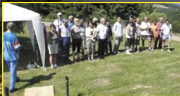
Nástup účastníků závodu