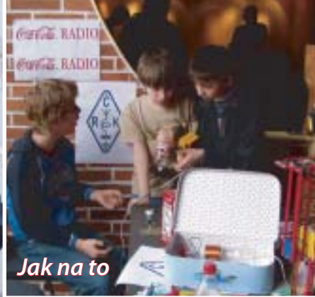
Jak na to