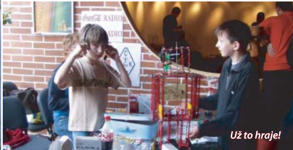
Už to hraje!